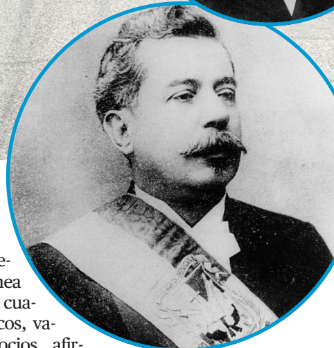
Juan Isidro Jimenes Pereira.

puerto, la altura de su morro, las piedras brillantes de su río, la amplia llanura y escarpada cordillera...”. El Almirante lo descubrió y bautizó en 1493.