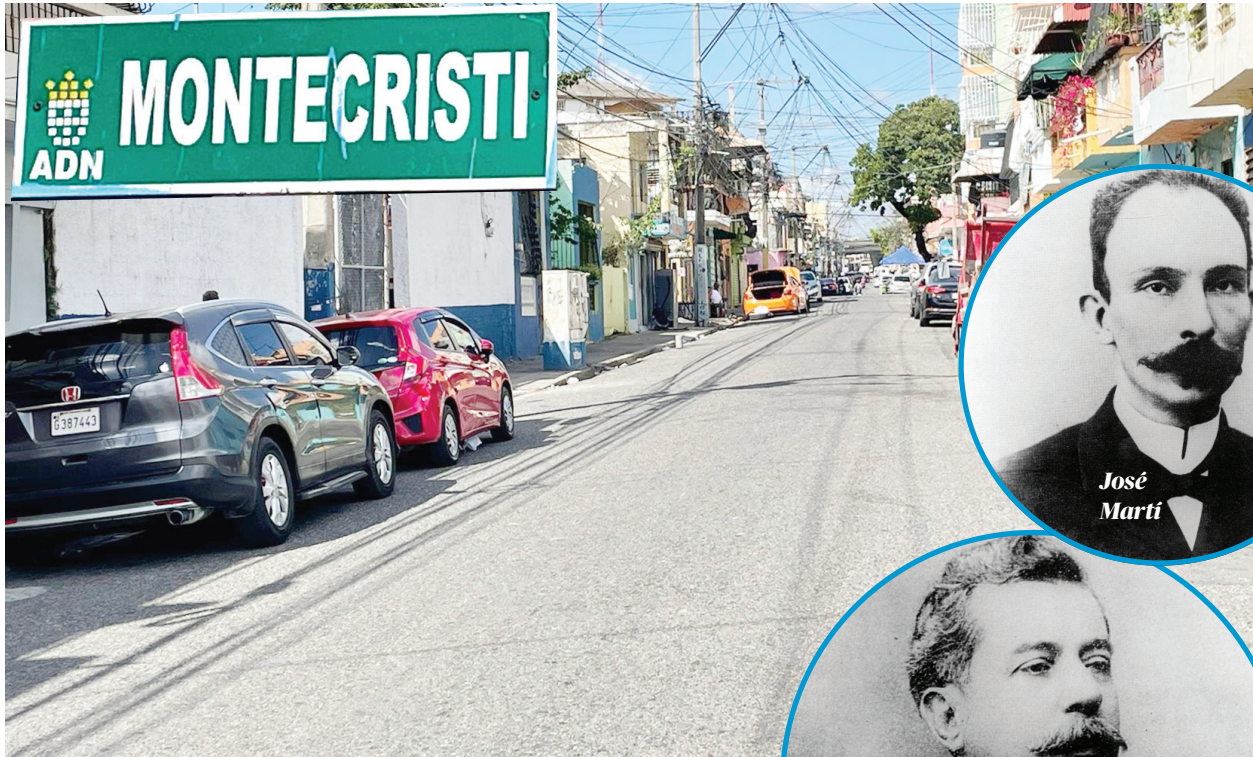
Calle Montecristi, en San Carlos.

No solo buscó apoyo a su causa, también visitaba