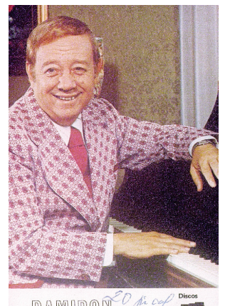
Francisco Simó Damirón