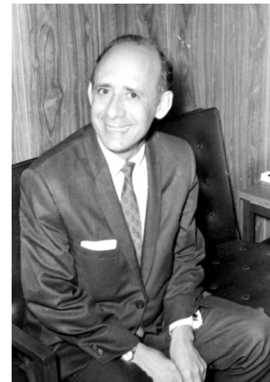
José Rafael Molina Ureña