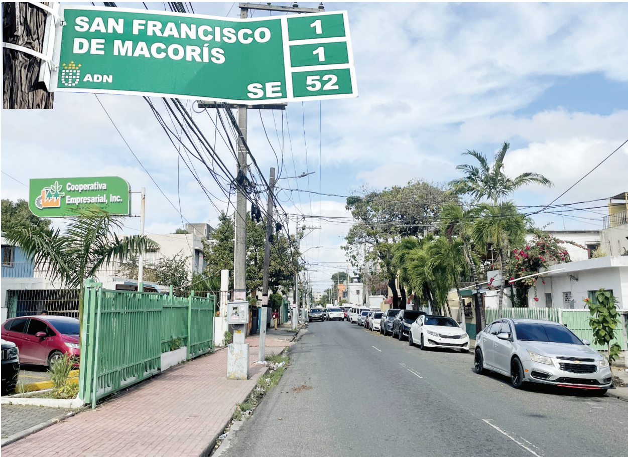
Calle San Francisco de Macorís, en lo que es hoy el sector Don Bosco.