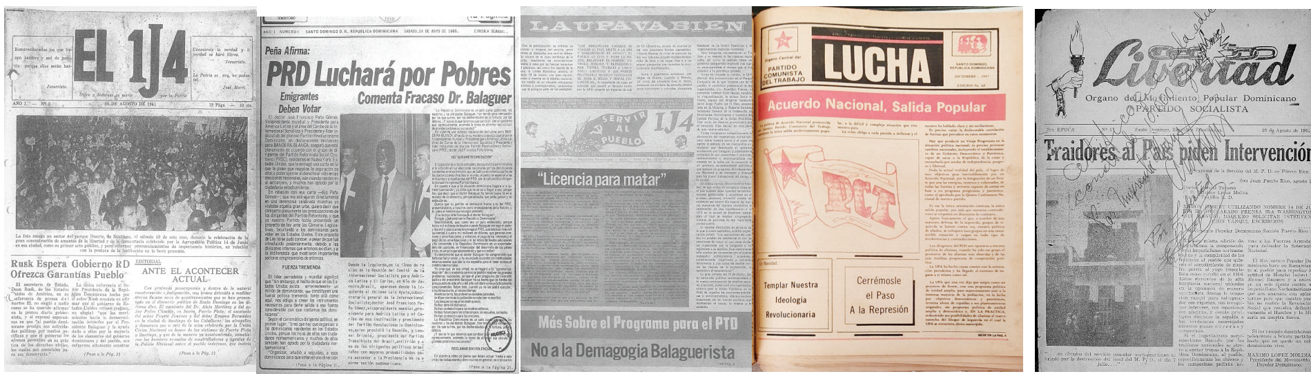
Periódicos dominicanos del antitrujillismo, de la izquierda y otros partidos políticos, la mayoría clandestinos.

En República Dominicana existieron una prensa y un periodismo apenas conocidos. Los responsables no eran empresarios de la comunicación. Y no perseguían lucrarse. Sus objetivos eran denunciar abusos de gobiernos represivos Y orientar ideológicamente. El precio no pasó de diez centavos el ejemplar. A veces regalado. Fueron clandestinos hasta después de 1978 voceros del antitrujillismo y de organizaciones de la izquierda perseguida, amordazada.